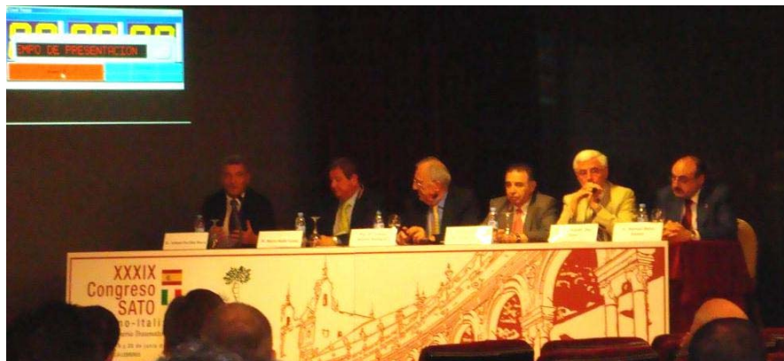
5ª Mesa Redonda. La Osteoporosis y sus complicaciones fracturarias"